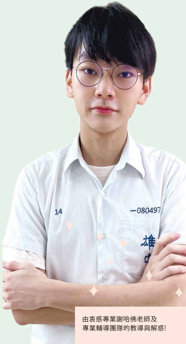
由衷感專業謝哈佛老師及專業輔導團隊的教導與解惑!