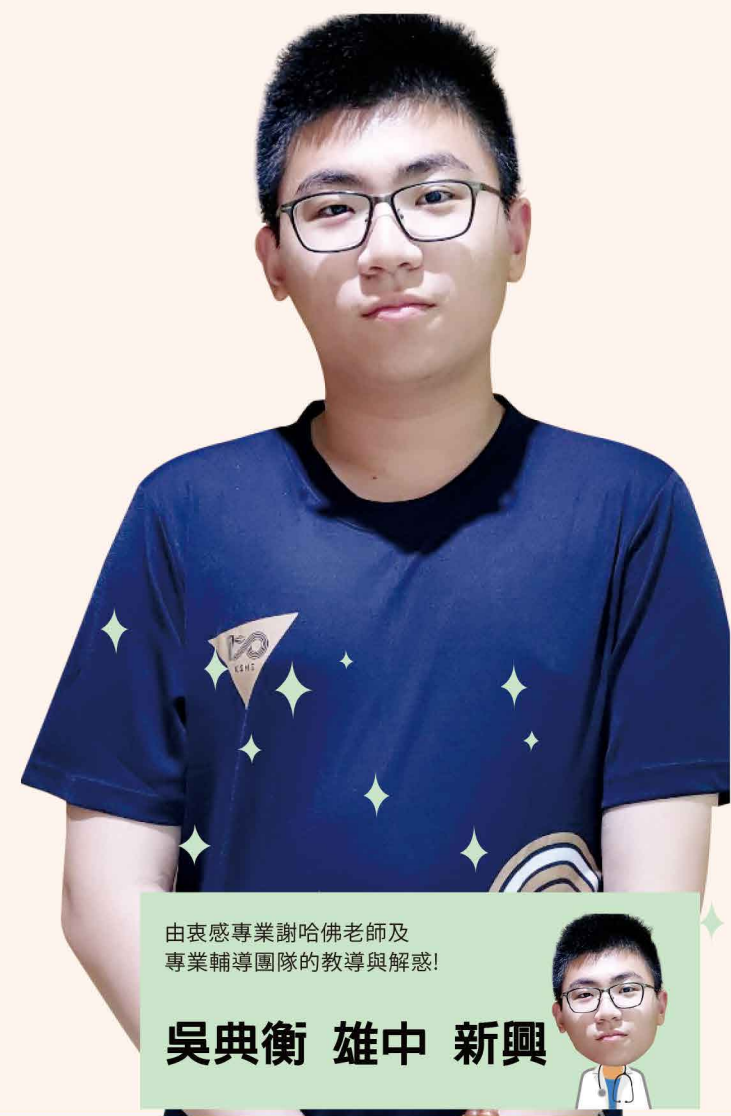
由衷感專業謝哈佛老師及專業輔導團隊的教導與解惑!