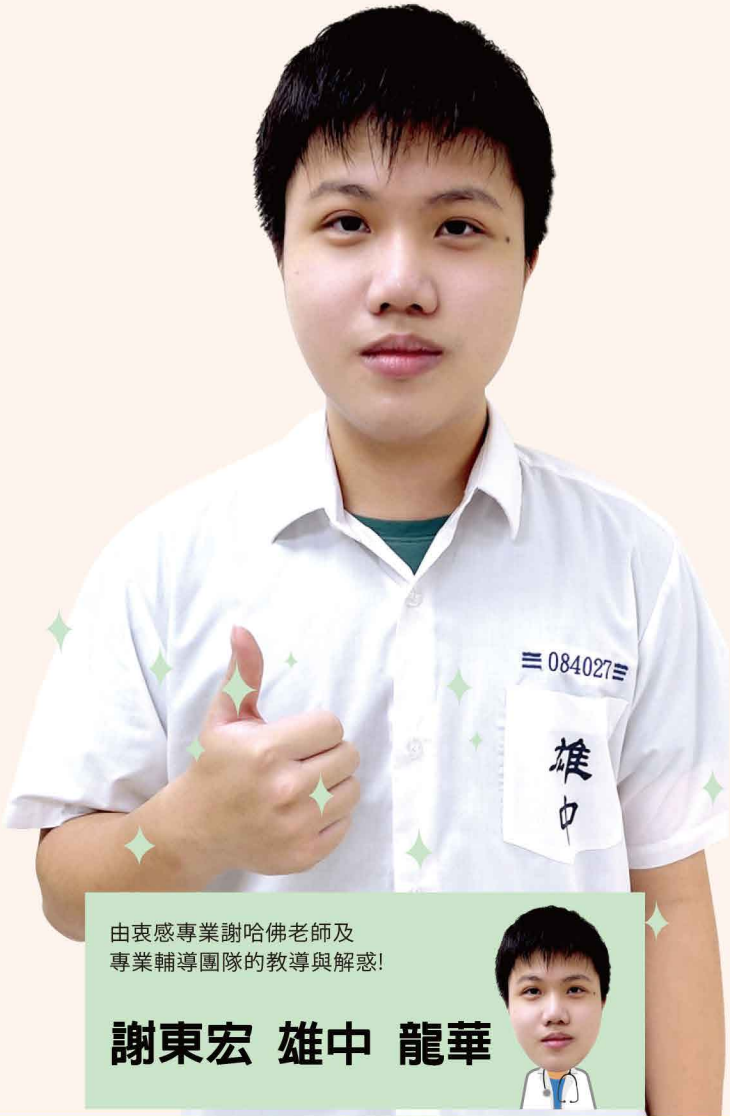
由衷感專業謝哈佛老師及專業輔導團隊的教導與解惑!