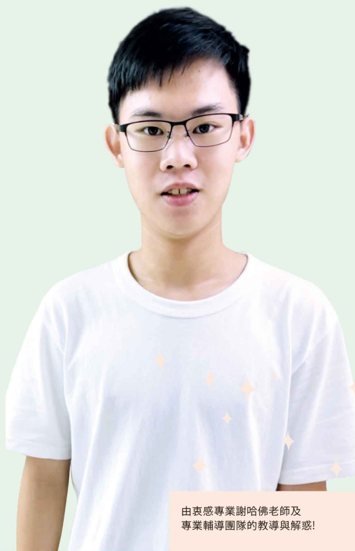
由衷感專業謝哈佛老師及專業輔導團隊的教導與解惑!