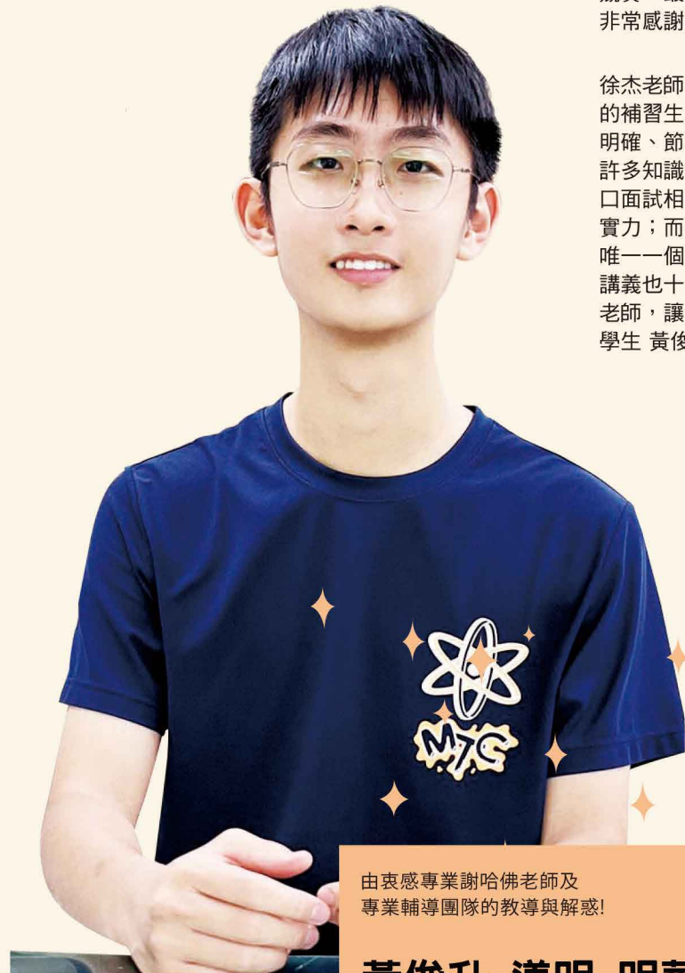
由衷感專業謝哈佛老師及專業輔導團隊的教導與解惑！